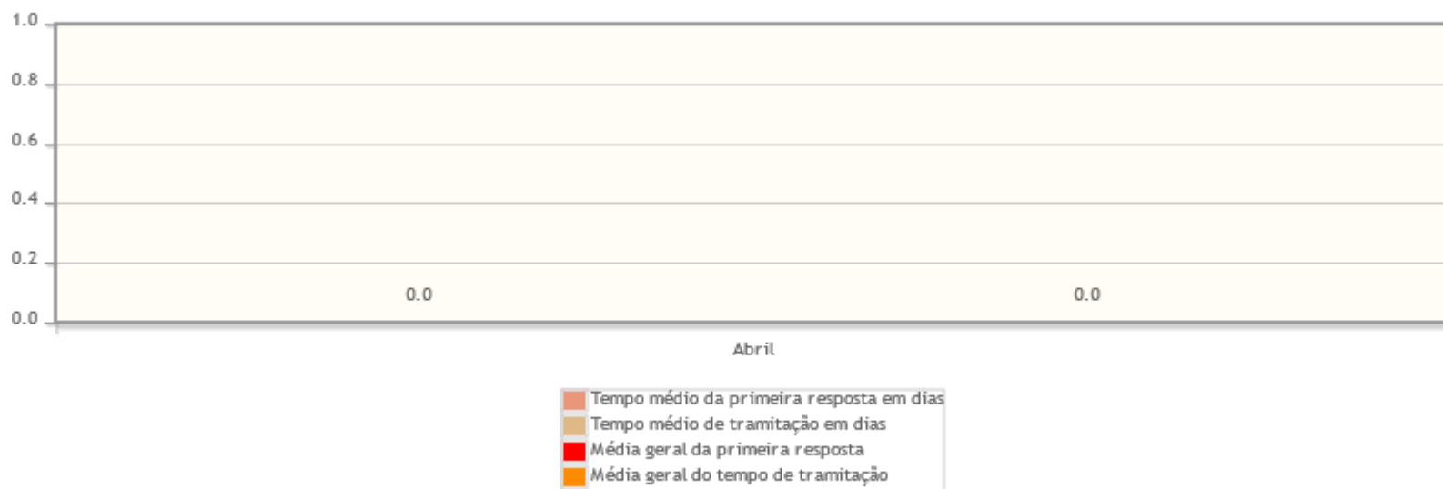
Tempo médio de tramitação por mês